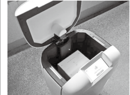
使用する配送ロボット

複数台の配送ロボットで屋内配送を施行 日本郵便 日本郵便は、オートロックシステム付きマンションなどの「屋内」でのラストワンマイル配送における配送ロボットの可能性を検証する、日本初の試行を実施している。期間は2月下旬〜3月下旬(予定)、場所は千葉県内のマンション。