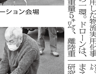
荷物を受け取る(鳥根県美郷町)