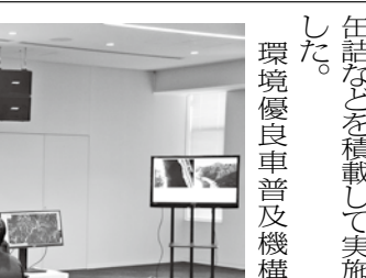
東京本社オペレーション会場

また、関西地域からの農水産物・食品の輸出促進を目的に、小ロット出荷に対応した混載輸送や品質保持のための輸送技術(庫内環境のコントロール、品質保持のための包装・梱包技術など)の活用を検証する試験輸送を21年度に実施することも確認した。