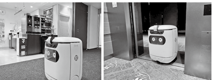
自律走行型配送ロボットが複数フロアへ

注文した商品を、「RICE」で東京ポートシティ竹芝のフロア内にあるエレベーターと連携して、自律走行型配送ロボット「RICE」がエレベーターを連携して、指定されたフロアへ配送を開始する。