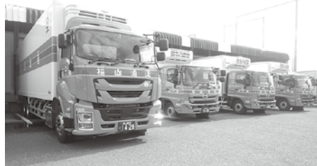
新規導入したチルド車両

新規導入したチルド車両の計15台を新規に導入。近中距離のチルド輸送店舗へのカゴルト配送を行う。